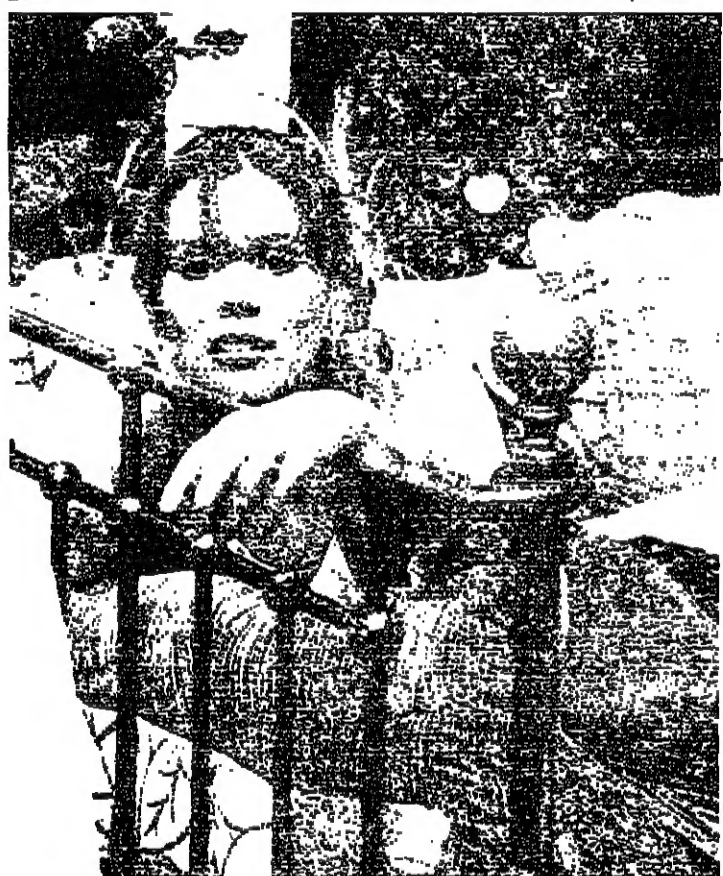
مطللة .. وام ايضا